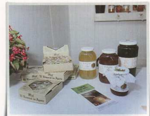
Miel de la comarca

Destacan dos guisos preparan por todos los pueblos del Valle: los gaspachos de monte, servidos sobre la torta tradicional. Las ollas, potajillos, el morteruelo y el calducho son platos sabrosos y contundentes, recomendados especialmente para los meses fríos. Destacar, también, el ajetao, el ajototo, el trigo picao y las gachamigas . Los grullas, el aguamiel y los almendrados , son los dulces más apreciados en la zona. Sin olvidar los melocotones y las cerezas . En Jalance se encuentra una empresa familiar de conservas artesanales de exquisita calidad, amén de la miel de producción casi ancestral pues su recolección aparece ya documentada en pinturas rupestres, y que hoy perdura, celebrándose todos los años la FERIA NACIONAL APÍCOLA en Ayora